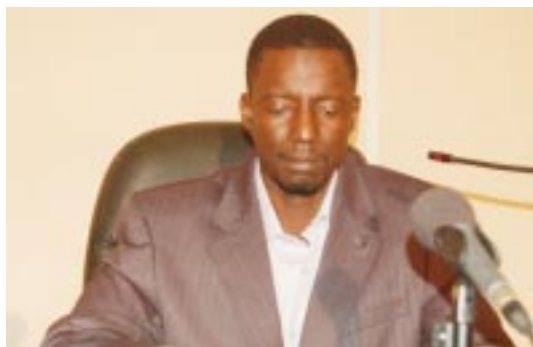
Marou Amadou, Président du Conseil Consultatif National

Le Premier ministre Danda et d'autres responsables de la transition étaient pratiquement à toutes les rencontres sous-régionales, régionales et internationales et rendu des visites dans le cadre du renforcement de nos liens avec les pays frères et amis. La transition suit son bon bout de chemin et tout indique que Djibo Salou et ses compagnons d'armes sont décidés à laisser aux futurs dirigeants, un pays où les citoyens auront toutes les raisons d'espérer que les énormes difficultés, l'instabilité et le déchirement entre les fils d'un même pays ne seront que des mauvais souvenirs. Asy