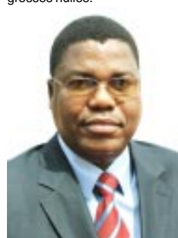
Abdourahamane Ousmane, Président de l'ONC